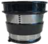
Filtro colador fino