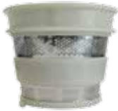
Filtro colador grueso